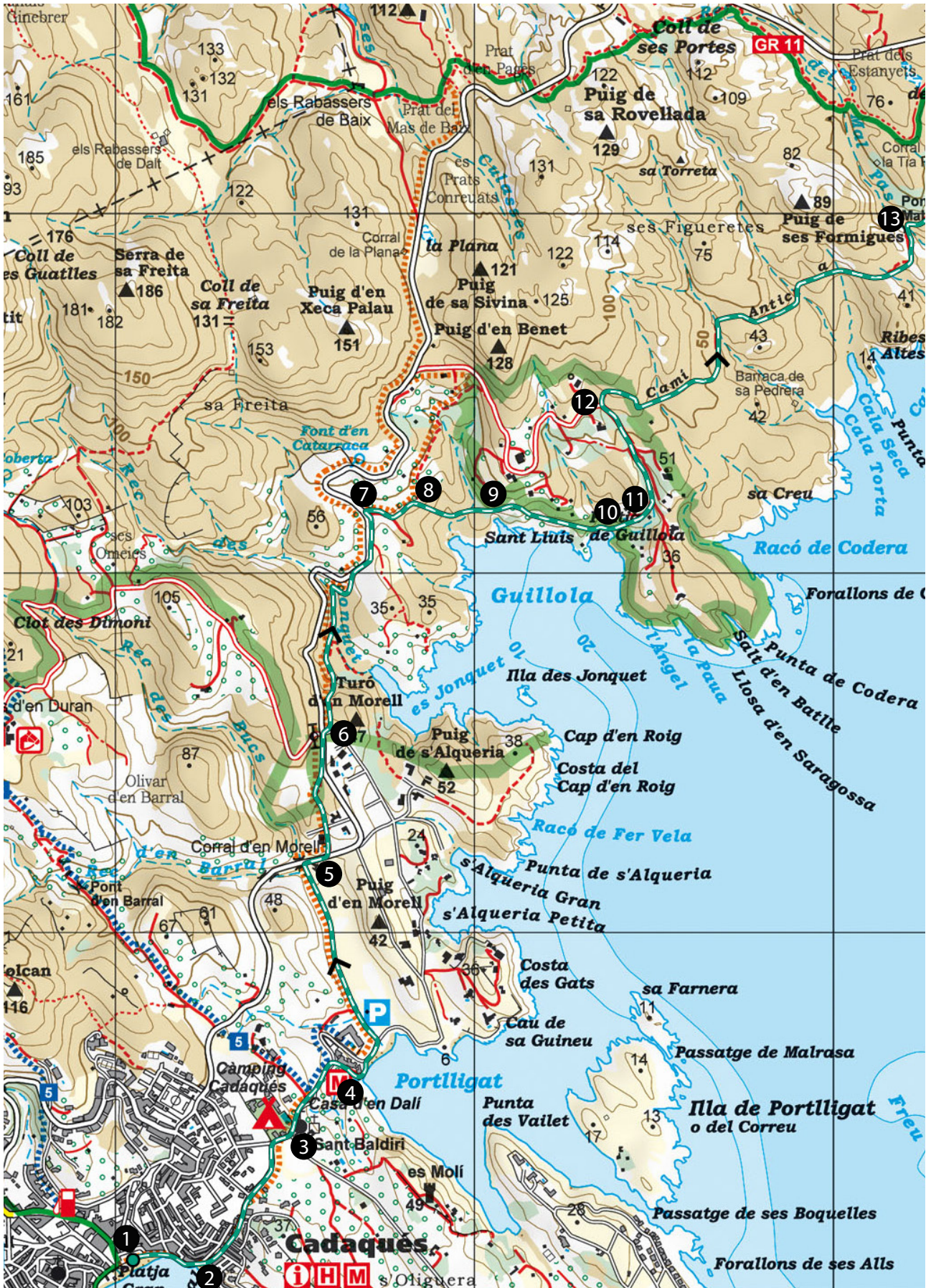
Camino Antiguo de Cadaqués al Cabo de Creus