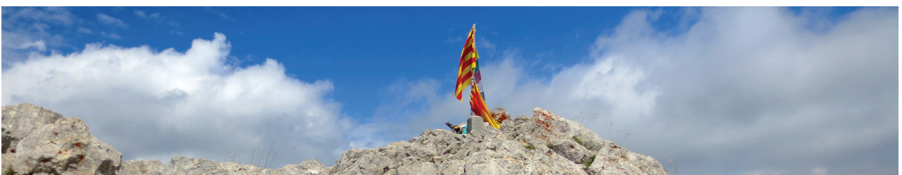
Pedraforca (2.506m) desde Gósol

Si la subida se nos hace muy pesada siempre podemos observar las escarpadas paredes y canales que tenemos a nuestra izquierda (N), donde a veces hace acto de presencia la gamuza , sola o en rebaño. Sobrepasamos un pequeño pinar, verdadero oasis en medio de un desierto pétreo, con un par de rampas bastante duras, y seguimos nuestra diagonal hasta que salimos al pintoresco collado de Pradell , desde donde ya tenemos la Enforcadura muy cerca. Desde este collado abordamos las últimas rampas, muy duras, hasta que advertimos que la pendiente se suaviza y alcanzamos la legendaria 3 Enforcadura (2:45h - 2.356m) , collado natural que une los dos picachos y que hace del Pedraforca un macizo tan especial y atrayente. Especialmente si es un día festivo nos sorprenderá la gran cantidad de gente que pasa por este collado: son los excursionistas que suben por la vía clásica del Verdet o por el canchal de Saldes. Desde aquí podemos ver la diferencia entre el Pollegó Inferior (E-SE), que nos queda a nuestra derecha, y el Pollegó Superior (N-NO), que nos queda a la izquierda. Coronar el Pollegó Inferior requiere hacer una escalada. En